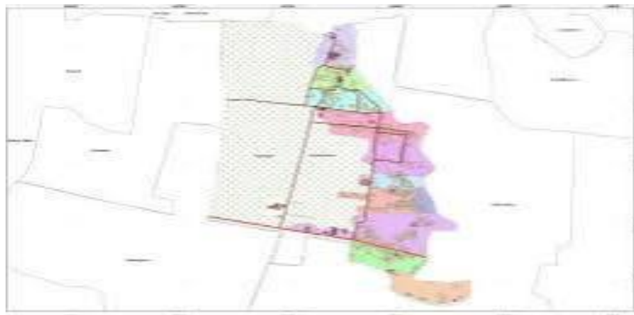
Gambar 1 Peta Desa Menjangan