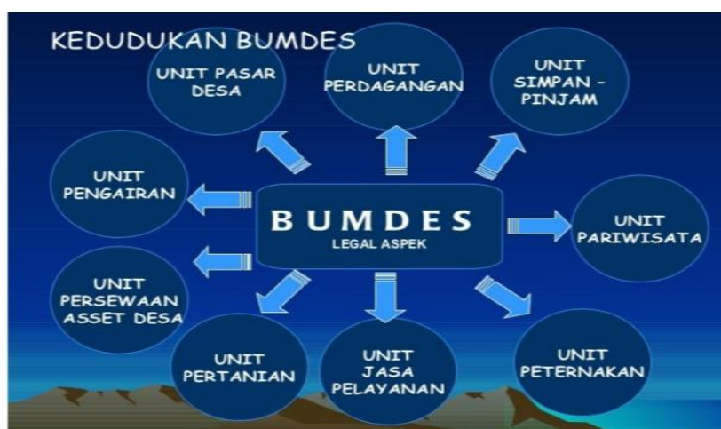
Gambar 6 Kedudukan BUMDes Dalam Menggerakkan Ekonomi Produktif Desa

BUMDes diharapkan akan menjadi motor penggerak ekonomi di pedesaan, dengan mengelola aset ekonomi desa secara kolektif oleh masyarakat. Prinsip dan esensi BUMDes harus diperkuat oleh semangat gotong royong dan swadaya sebagai upaya untuk memperkuat dimensi ekonomi kelembagaannya. Pada fase ini, BUMDes akan berperan aktif dalam meningkatkan pendapatan asli desa dan memajukan aktivitas ekonomi masyarakat, di mana BUMDes berfungsi sebagai entitas utama yang mengkoordinasikan upaya tersebut. Hal ini juga penting dalam rangka mengurangi praktik free-rider yang dapat meningkatkan biaya transaksi dalam kegiatan ekonomi masyarakat, seperti yang dijelaskan oleh Nurcholis (2011, h. 88).