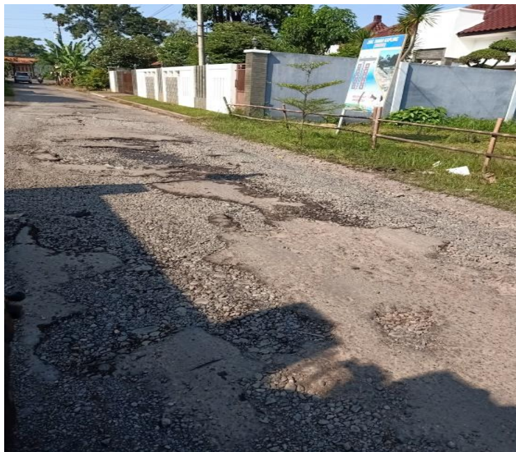
Gambar 5 Kondisi Infrastruktur Jalan RT. 10/ RW. 04

Melihat kondisi ini, perbaikan jalan di Desa Menjangan sudah menjadi kebutuhan mendesak. Perbaikan jalan tak hanya akan meningkatkan keselamatan dan kenyamanan pengguna jalan, tetapi juga memperlancar arus transportasi dan roda ekonomi di desa. Selain perbaikan jalan, pemasangan rambu-rambu peringatan di area genangan air juga perlu dilakukan. Hal ini untuk membantu pengguna jalan agar lebih berhati-hati dan menghindari potensi kecelakaan. Koordinasi dengan pihak terkait untuk pemeliharaan jalan desa secara berkala juga tak kalah penting agar kondisi jalan di Desa Menjangan dapat terus terjaga dan memberikan pelayanan terbaik bagi masyarakat.