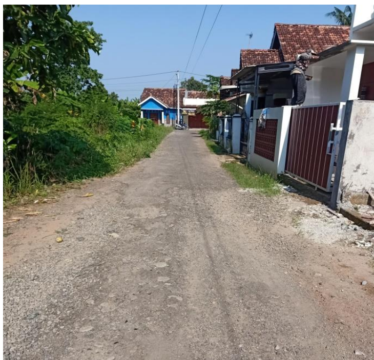
Gambar 4 Kondisi Infrastruktur Jalan RT. 07/ RW. 03

Kondisi jalan yang rusak parah di Desa Menjangan telah menjadi keluhan utama dari para pelaku ekonomi, termasuk pedagang, petani, dan industri. Kerusakan jalan di beberapa area desa ini mengakibatkan terhambatnya pergerakan barang dan jasa, meningkatnya biaya transportasi, dan bahkan risiko kecelakaan. Dampaknya meliputi kerugian finansial, penurunan pendapatan usaha, serta gangguan pada aktivitas ekonomi secara keseluruhan. Melalui wawancara dengan masyarakat, terutama para pelaku ekonomi, mereka menegaskan pentingnya pemerintah desa segera mengambil langkah perbaikan. Mereka berharap jalan rusak dapat segera diperbaiki dan ditingkatkan kualitasnya, agar aktivitas ekonomi dan kehidupan sehari-hari dapat berjalan lancar dan aman. Perbaikan infrastruktur jalan yang baik adalah langkah krusial untuk mendukung pertumbuhan ekonomi dan kesejahteraan masyarakat Desa Menjangan. Pemerintah desa perlu merespon keluhan masyarakat dengan serius dan segera bertindak untuk memperbaiki kondisi infrastruktur jalan. Dengan demikian, diharapkan dapat menciptakan lingkungan usaha yang kondusif dan meningkatkan daya saing ekonomi di Desa Menjangan. Berikut dokumentasi yang diambil beberapa waktu lalu yang menunjukkan kondisi infrastruktur jalan Desa Menjangan di sejumlah titik tertentu.